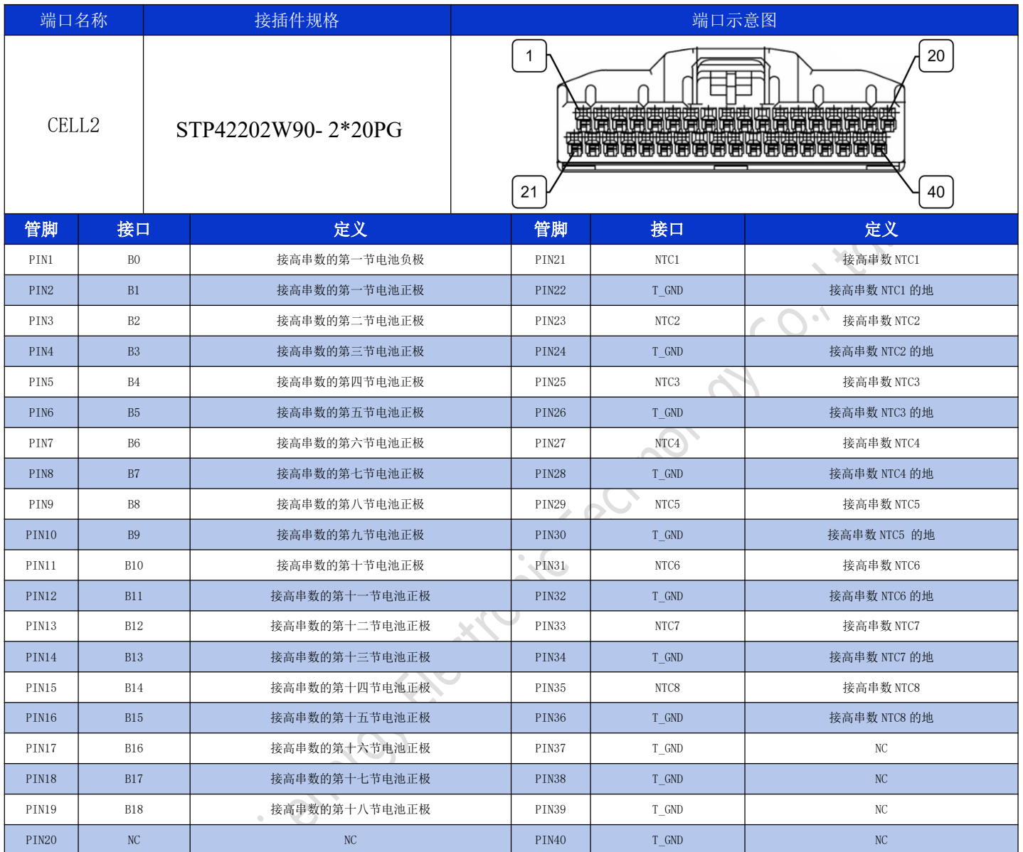
表 7-CELL2 接口定义